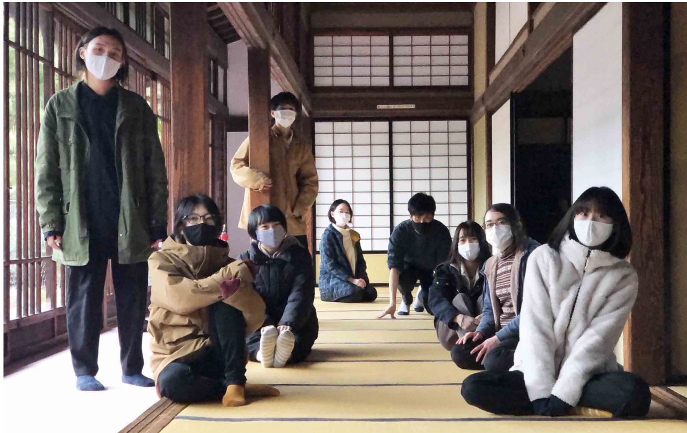
会期中はその日の終わりに集合写真を撮っていました。また、その日に気づいたことや直したいこと、その解決策などを話し合い、改善していきました。実際に行うことで気づかされることが多くあり、日を過ごすことにより良い企画展になっていきました。

企画展「現点」は造形・メディアデザインコースの「立体表現演習IIB」という授業の通し課題として行われた展覧会（2021年3月3日～8日）です。「作品を作り、それらを展示するための展覧会を企画し、大学外に発表する」という授業内容に興味を持った創造工学部 造形・メディアデザインコースの3年生10人が、各々の作品制作と企画展の運営を行いました。—これまでとこれからの間で—をテーマとし、「これまでのことをどのようにこれから繋いでいくのか」について、10人それぞれが香川大学でデザインやアートを学ぶ意味を考えながら、作品に落とし込む形で制作活動を行いました。