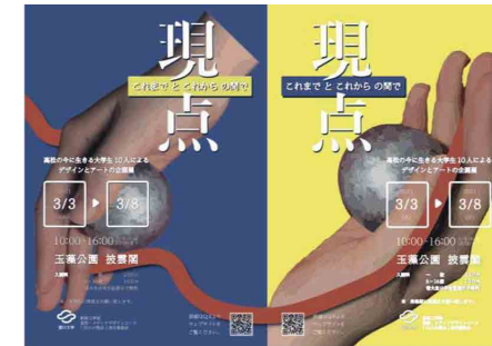
完成したポスター/鉄球と手は実際に撮影。鉄球は私たちが入学して初めて作った原点といえる作品です。こちらをモチーフとしてポスターを作成しました。