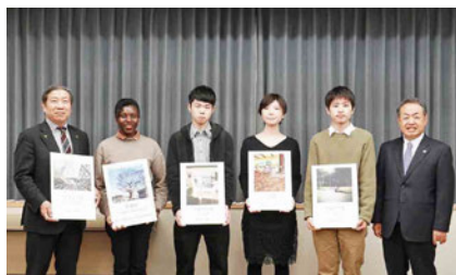
寛学長(右端)、山神広報室長(左端)、受賞者とともに

香川大学の魅力を広く発信することを目的として、Instagramを利用したフォトコンテストを実施。(応募期間：R2年11/1～R3年2/14) 58点の応募作品の中から、学長賞1点、広報室長賞1点、アイデア賞2点、特別賞1点が決定。授賞式を3月25日に行い、寛学長より賞状と賞品が授与されました。