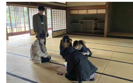
披雲閣の方への挨拶と会場の視察に行きました。私はこの時に初めて披雲閣の中に入りました。この時はまだ作品制作を行っていなかったため、会場の規模や雰囲気から作品を考えていきました。