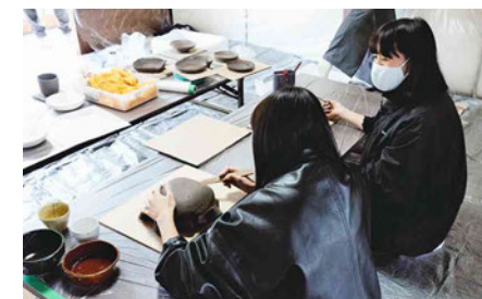
ろくろよりも簡単に陶器を作ることができる板づくり体験。好きな形の型を選び、絵を描いていただきました。大人から子供まで多くの人に楽しんでもらいました。