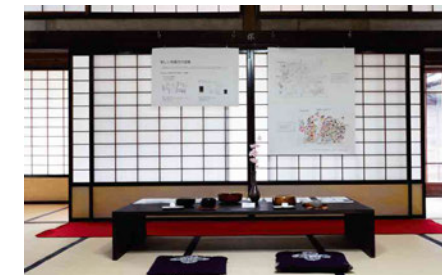
新しい和菓子の提案をした作品です。机や座布団を使い、披雲閣の雰囲気も相まって実際にお茶に呼んでもらったような気持ちで見ることができる作品でした。メンバーは実際に作った和菓子の試食もさせてもらいました。