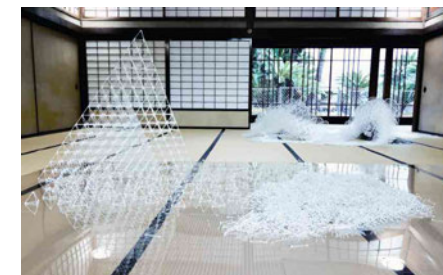
手前/正四面体を連ねることで石垣に見せた作品。会期中も形を変え、6日間を通して見たときにも面白い作品でした。今も変化しています。奥/うちわだけを使って作られた作品。本当にうちわしかっていないのかと思うほどの迫力でした。