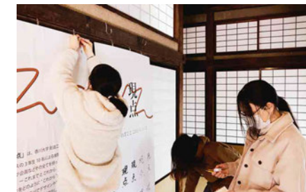
作品の搬入では建物に傷をつけないための工夫を行いながら展示をしました。実際に実物を置きながらより良い配置を考えていきました。