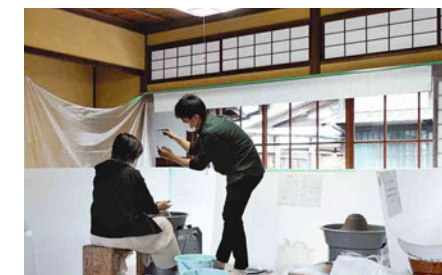
土日限定で行ったろくろ体験のワークショップ。初めてろくろを触るという人にも楽しんでもらえるように試行錯誤。学生がサポートし、思い思いの陶器を作ってもらいました。