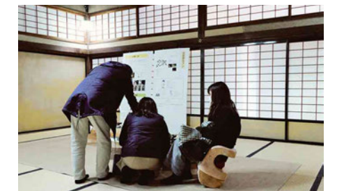
作品を見ている人の中には椅子に座って写真を撮っている人や説明のボードをじっくりと見ている人がおり、楽しみ方はそれぞれだなと感じました。また、知らない人に作品を見てもらうことは初めてだったため新鮮な気持ちになりました。