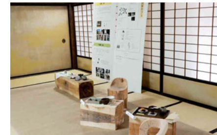
私は共同制作で古民家カフェの提案を行いました。古民家についての調査を行い、四国村で実際に古民家を見ることから始めました。これまでに大学で習ったことも参考にしながら、新しいことに挑戦することができました。