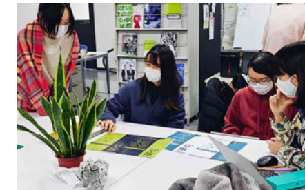
ポスターは現点のイメージを左右するため何度も話し合って作成しました。予算や部数の関係から「2種類のチラシを組み合わせることでポスターとしても使えるデザイン」というコンセプトから考えていきました。