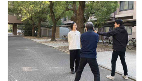
Webページ用の写真を先生に撮影していただきました。より良い写真スポットを探して大学内を歩き回りました。先生がノリノリで一人ひとりの写真を撮影されていたのが印象深いです。