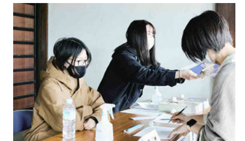
受付ではポスターと会場案内を配布。帰る際に企画展の感想を話してくださる方もおり、楽しくお話を聞かせていただきました。自分たちの作品がどのように見えているのかを聞けるチャンスは、なかなかないため良い機会になりました。