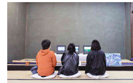
玉藻公園を遊園地に見立てたアニメーションの作品です。香川の伝統的なことと未来を掛け合わせたような可愛くて面白い作品で座布団に座っていつまでも見ていられるような作品でした。